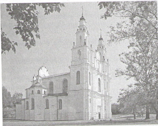
Современный (перестроенный) вид Софійскага сабора ў Палоецке

— Выдающимися помнікамі зодчества XII в. являюцца Спаская царква Палоецкага Спасо-Ефросіньевскага манастыра і Борысоглебская царква ў Гродно.