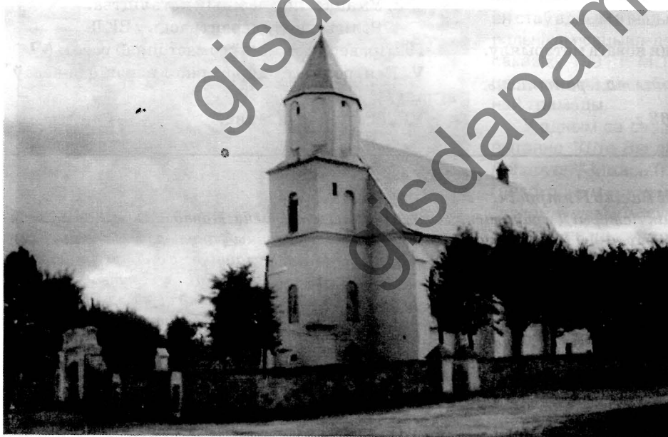
Касцёл Звеставання Дзевы Марыі ў в. Дзераўная Стаўбцоўскага раёна.

Клас дзеліцца на 4 групы па колькасці пунктаў у § 23 вучэбнага дапаможніка. Кожная група чытае адпаведны пункт вучэбнага дапаможніка і афармляе выхадную картку свайго задання (да 10 хв.).