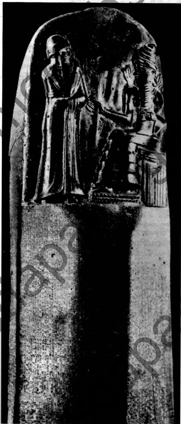
Слуп з законамі Хамурапі.

Краязнавец — чалавек, які займаецца вывучэннем свайго краю, краязнаўствам.